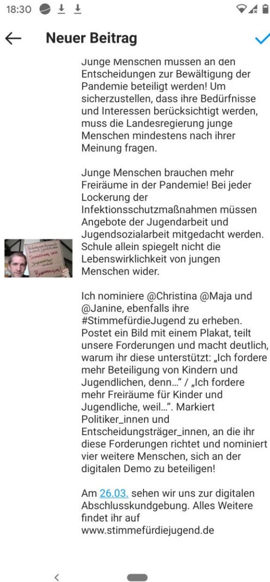
Bild herunterladen, auswählen und den Text einfügen